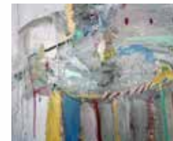
Algunas de las obras presentadas en 2017