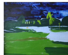
Algunas de las obras presentadas en 2018